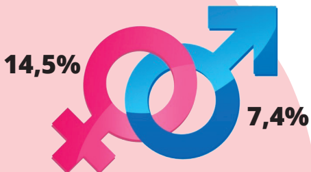
Datos estadísticos nacionales

LAS MUJERES INFORMADAS Y EMPODERADAS PROTEGEN SU SALUD, LA DE SUS HIJOS Y DE SU FAMILIA.